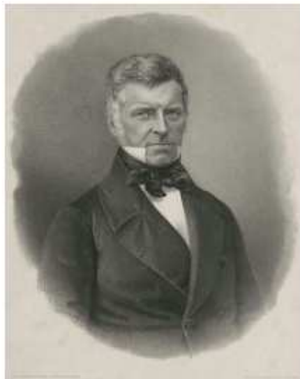
Porträt von Augustin Keller

«Die Erziehung des Volkes soll nicht die listige Schlange am Baume der Erkenntniß sein, welche es um seine Unschuld und das Glück seines Paradieses bringt, sondern vielmehr ein Baum des Lebens, an dessen Stamme ihm durch das Licht der Wahrheit die Erlösung wird.»